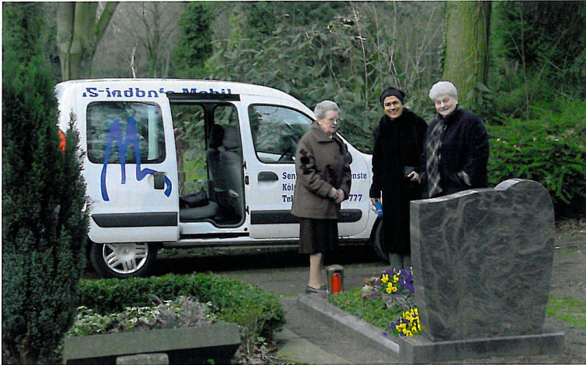
Das Kölner Friedhofsmobil erleichtert älteren Menschen den Grabbesuch.